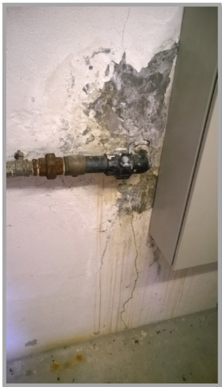
Obrázek č.3: (Sanitr ve výměníku)