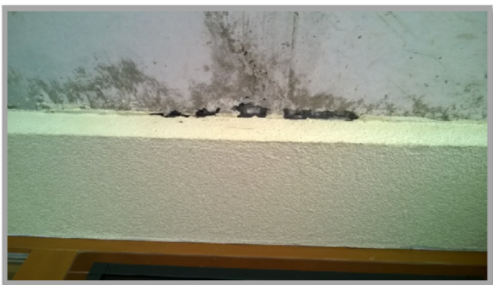
Obrázek č.2: (poškozená krycí vrstva v podhledu)

Podhled nad vstupy v 1.NP vykazuje lokálně poškození krycí betonové vrstvy, kde hrozí riziko koroze nosné výztuže.