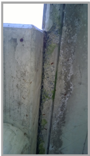
Obrázek č. 4: (Poškozená betonová krycí vrstva)

Dilatace mezi schodištěm a betonovou deskou přístupové chodby je chybně provedena. Spoj není proveden vodotěsně, čímž dochází k poškození a odlupávání krycího betonu stropní desky. Dlažba na schodišti nevykazuje známky poškození. Vajma v místě dilatace.