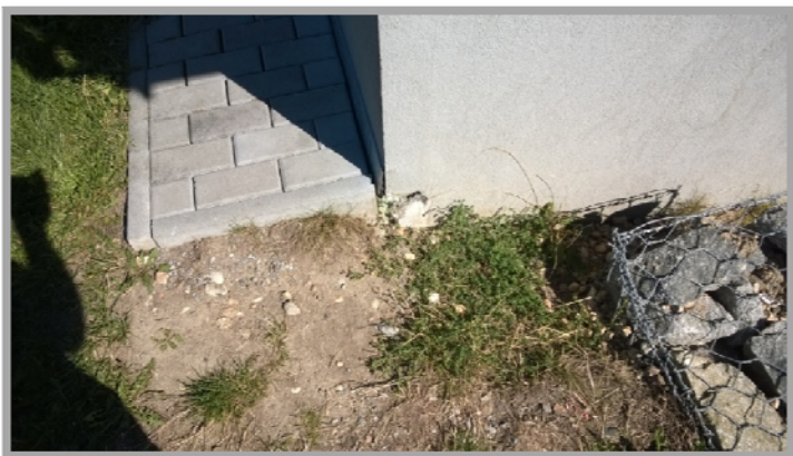
Obrázek č.1: (poškození fasády)