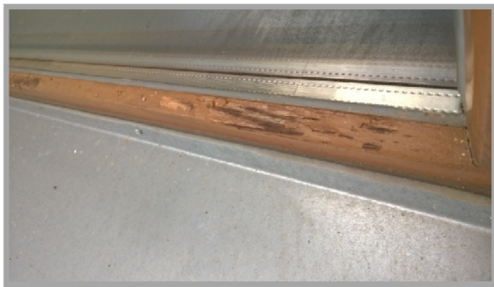
Obrázek č.2: (chybějící okapnička – ilustrační foto z objektu č.p. 38)

Výplně otvorů na schodištích lze jen velmi obtížně otevřít.